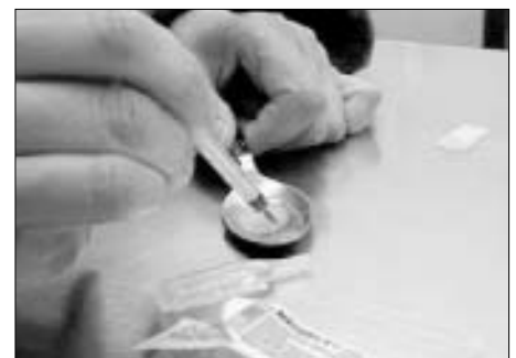
Seit 2001 besteht im Haus der Konsumraum

Das „Gleis 1“-Modell funktioniert gerade deswegen, weil auch die Zusammenarbeit mit den relevanten Behörden gepflegt wird. Gemeinsam hofft man, mit dem Drogenkonsumraum vor allem die Todesfälle zu reduzieren und die Zahl der Infektions-Begleiterkrankungen, sowie die Beschaffungskriminalität senken zu können. Ferner werden eine psychosoziale Betreuung und die drogentherapeutische Ambulanz in das Angebot in dem alten Bahnhofsgebäude integriert. Hier steht das Ziel im Vordergrund, nicht nur die Motivation zum