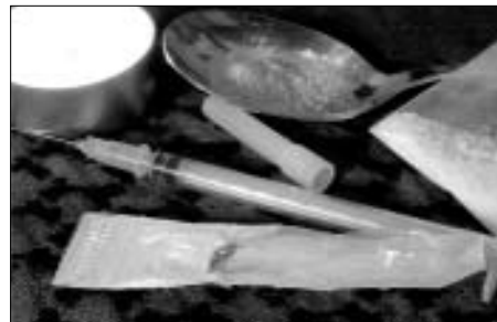
„Clean Streets“ entsorgt fachgerecht Fixerbestecke

2003 erfolgte die Anerkennung, wonach die Kostenübernahme für die Behandlung eines Drogenabhängigen von den Krankenkassen finanziert wurde. Somit wurde die Behandlungsplatzzahl ausgebaut. Die ärztliche Behandlung erweiterte sich und eine verbindliche Begleitung der